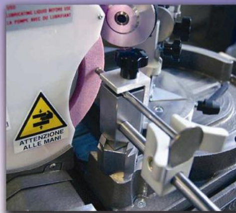
Rettifica del piede valvola Valve end refacing