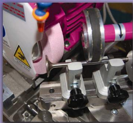
Lavorazione del fungo valvola Processing of the valve head

The RV3000 valve refacer marks a new phase in valves refacing. Its double-V operation, instead of the traditional use of pliers or chucks, brings to very accurate results and is extremely easy. The peculiar valve locking system can be applied on a wide range of engines.